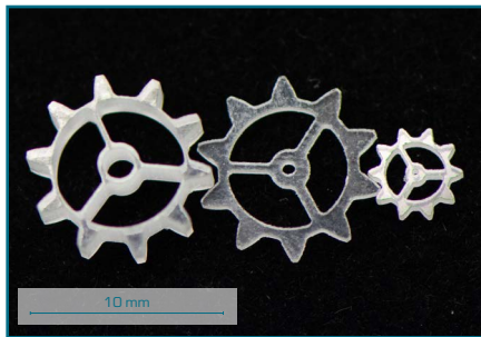
Découpe de verre

Les lasers à impulsion brève ou ultra brève permettent d'usiner les matériaux transparents avec ou sans enlèvement de matière mais aussi de modifier leurs caractéristiques physiques dans le volume.