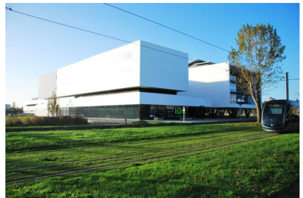
Entrée principale du bâtiment Avenue des Facultés