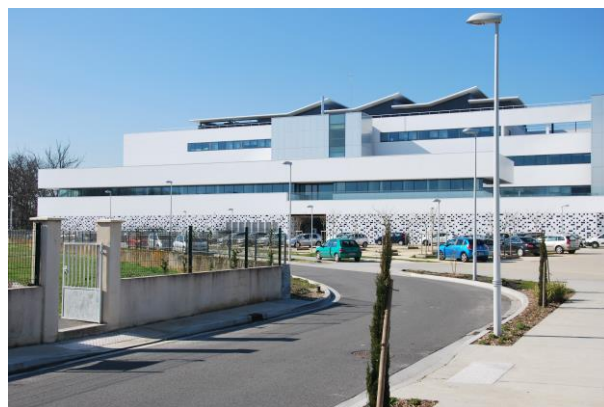
Vue d'ALPhANOV depuis la rue François Mitterrand