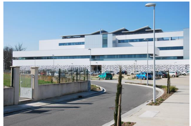
Vue d'ALPhANOV depuis la rue François Mitterrand