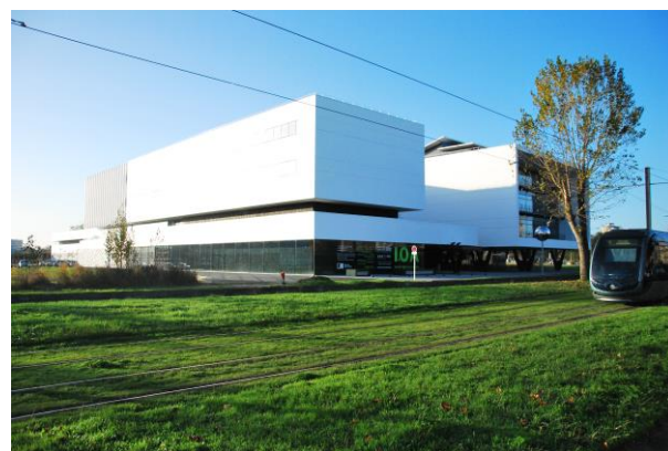
Entrée principale du bâtiment Avenue des Facultés